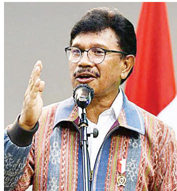
Johnny G Plate

JAKARTA – Kementerian Komunikasi dan Informatika (Kemkominfo) akan memulai penataan ulang ( refarming ) pita frekuensi radio 2,3 GHz di sembilan klaster. Kegiatan tersebut dilakukan untuk meningkatkan layanan seluler dan mengoptimalkan frekuensi, termasuk untuk implementasi layanan 5G.